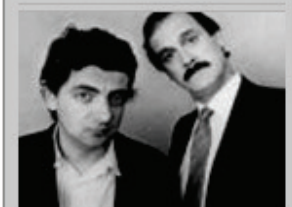
John Cleese i Rowan Atkinson tijekom provoda.